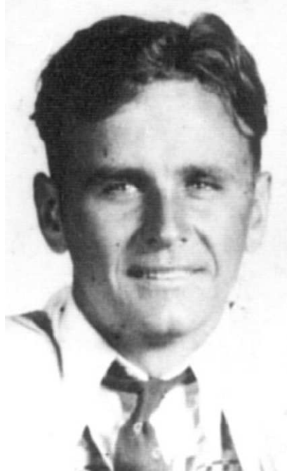
வில்லியம் மரியன் பிரன்ஹாம்